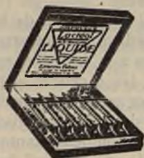
Lactéol-Líquido del Dr BOUCARD Ampollas de bacilos lácticos.

Modo de emplearlo: 9 a 12 comprimidos al día, desleídos en un poco de agua azucarada antes de las comidas