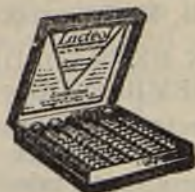
Lactéol del Dr BOUCARD Comprimidos de bacilos lácticos

El Lactéol del Dr BOUCARD (Comprimidos de bacilos lácticos) realiza una desinfección intestinal rápida Enteritis, Diarreas, Infección y autointoxicación intestinal.