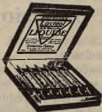
Lactéol-Líquido del Dr BOUCARD Ampollas de bacilos lácticos

9 a 12 comprimidos al día, desleídos en un poco de agua azucarada antes de las comidas