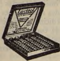
Lactéol del Dr BOUCARD Comprimidos de bacilos lácticos

El Lactéol del Dr BOUCARD (Comprimidos de bacilos lácticos) realiza una desinfección intestinal rápida Enteritis. Diarreas. Infección y autointoxicación intestinal.